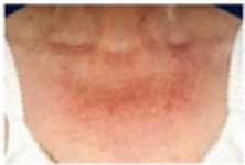
Poikiloderma van Civatte