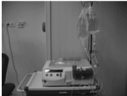
Afbeelding 3: opstelling Home Choice (bron Maasstad Ziekenhuis)

Bij de CAPD vinden vier handmatige wisselingen overdag plaats. Bij de APD voert de machine, de Home Choice, na het aansluiten een vooraf bepaald aantal wisselingen voor u uit.