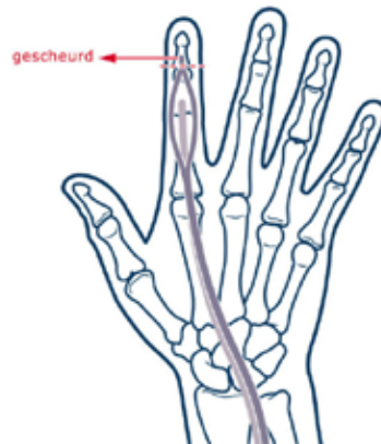
Er ontstaat letsel aan de strekpees op de aanhechting in het uiterste kootje

Dit gebeurt bijvoorbeeld bij het vangen van een bal of het opmaken van een bed. Hierdoor scheurt de strekpees van het vingerkootje van de top van de vinger af (vaak de langste vinger). Soms breekt ook een stukje bot af van dit vingerkootje (avulsie fractuur). In beide gevallen gaat het topje van de vinger afhangen. Het lukt niet meer om de vinger actief te strekken en de vinger lijkt dan op een hamertje (het Engelse woord voor hamer is 'mallet').